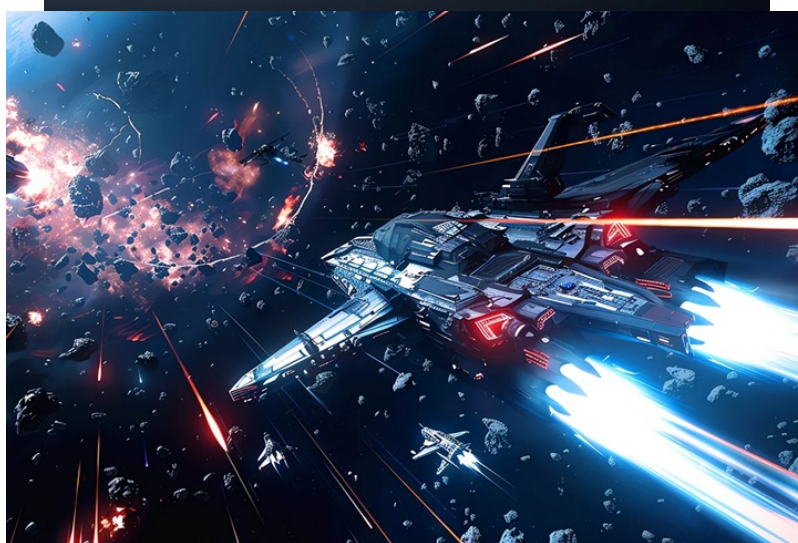
BenQ Mobiuz EX251