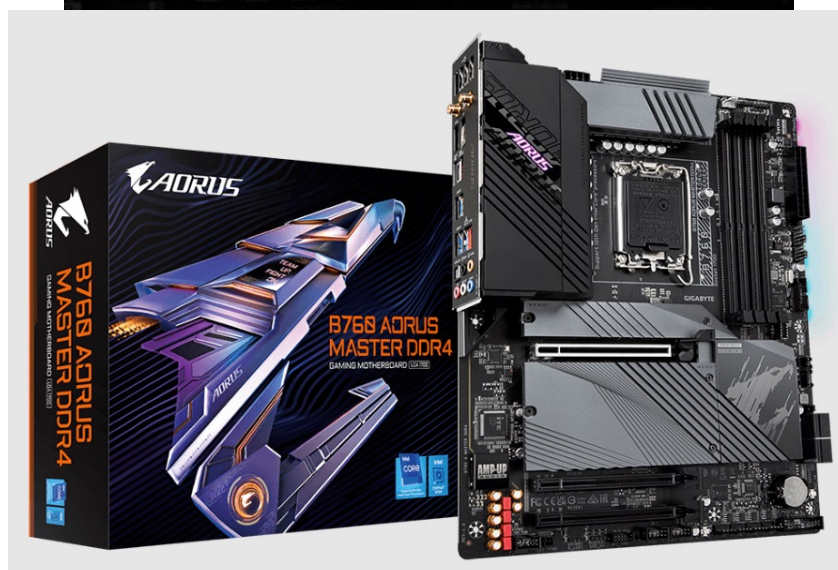
GIGABYTE B760 AORUS MASTER DDR4