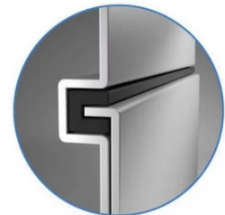
Sealed Lock-and-Key Design

Na zadní straně je k dispozici celá řada portů, mezi nimiž vyčnívá především rozhraní HDMI 2.0 , které zajistí snadné promítání 4K obsahu při vyšším jasu a kontrastu oproti standardnímu rozlišení. Jas je klíčem k viditelnosti. I proto nabízí projektor BenQ LU9245 funkci dynamického tlumení jasu dle scény a optimalizuje světelný výkon a kontrast pro co nejlepší obraz.